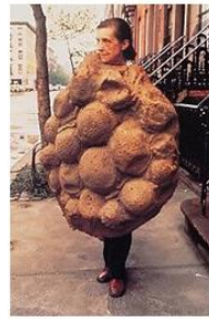
לואיז בורזואה עם תלבושת מלטקס, 1975