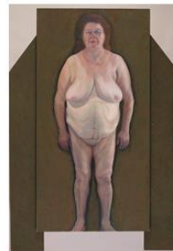
חוה ראוכר, לילה בארץ ישראל, 1994, שמן על בד ודיקט 220X152