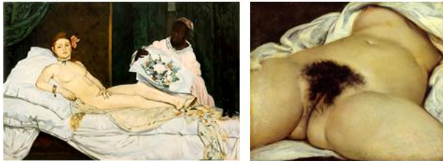
ימין: קורבה, מקור העולם, 1866, 55X46, אורסיי, פריז, שמאל: מאנה, אולימפיה, 1863 (סלון 1865), 190X130.5, אורסיי, פריז.

כך או כך - לא משנה לפי איזה פרופורציות או חוסר פרופורציות מתואר העירום הנשי ובין אם הוא עירום או מעורטל - עד המאה ה-19 העירומות היו בדרך כלל נשים יפות, חושניות ואפילו מיניות. במאה ה-19 העירום הנשי עבר תהליכים שונים וה-nude כמעט ונעלם, ומספיק אם אזכיר העירום הבוטה במקור העולם של קורבה או באולימפיה של מאנה, שהיא אולי פחות מגרה אבל בהחלט מוכרת את הסחורה.