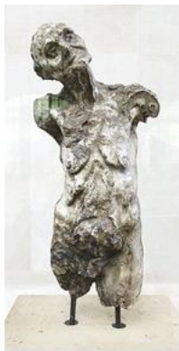
קמיל קלודל, קלותו (הצעירה) משלושת הגורלות) 1893, גבס. 44 ס"מ, אורסיי, פריז