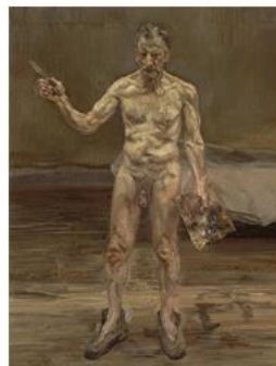
לוסיין פרויד, אמן בעבודתו, השתקפות, 1993, 101.6X81.7

אך בעשורים האחרונים החל להופיע עירום מסוג חדש, לאו דווקא של נשים כואבות, חולות או פגומות, אלא סתם נשים שהתבגרו או הזדקנו בדרך הטבע. כל זמן שהזקנה מיוצגת על ידי נשים לבושות, כמו אצל רות שלום או גיימס מקניל ויסלר (תמונה 14), אנחנו מקבלים זאת כחלק מהמציאות המוכרת לנו ואפילו מגלים אמפתיה. אבל העירום של נשים מבוגרות, ועוד יותר של נשים זקנות, סוטה כל כך ממושגי היופי המסורתיים, עד שהוא מבהיל אותנו. הוא מעורר בנו תגובות נפשיות ופיזיות כאחת, כי הוא מדגיש את הבלות, את העיוות, את המפלצתיות, הגרוטסקיות והבזות של הגוף. עירום כזה מציב בפנינו מראה, כי גורל כולנו להגיע למצב הזה ואין ביכולתנו לעשות דבר נגד הטבע ולכן קשה לנו לקבל עירום מבוגר. אחת החלוצות של הצגת הגוף המבוגר בדיוקן עצמי בעירום הייתה הציירת אליס ניל. ניל מציגה את עצמה כדמותה ומדגישה את מקצועה - ציירת. אין כאן כאב ולא מחלה ולא פגמים ועיוותים, אלא סתם זיקנה. תהליך שבסופו של דבר יקרה לכל-אדם. כך גם מצייר את עצמו לוסיאן פרויד - צייר בעבודה. שניהם אמנם זקנים, אך עדיין מציירים ולכן רואים את עצמם עדיין רלוונטיים.