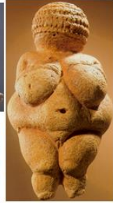
נוס מווילנדורף, 30 אלף עד 20 אלף לפנה"ס, אבן, גובה 11 ס"מ, מוזיאון הטבע, וינה