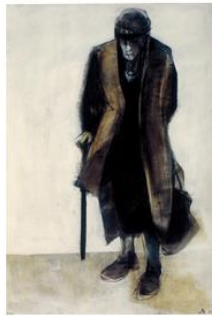
רות שלום, אשה זקנה, 1996, אקריליק על נייר, 80X117, אוסף ליפשיץ הרצליה