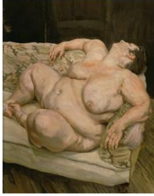
Freud, Benefit Supervisor Resting , 1994, Oil, 160 x 150,