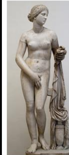
מימין: פרקסיטלס, אפרודיטה מקנידוס, מאה 4 לפנה"ס; ונוס ממילו מאה 2 לפנה"ס.

עירום Nude מופיע גם מאוחר יותר, למשל בציור של ז'רום האורינטליסט מהמאה ה-19, פְּרִינָה (Phryne) נחשפת בפני בית המשפט. הציור האחרון מראה עד כמה העירום שמייצג את היופי האידיאלי הנו ערך עליון, הגובר אפילו על חוקי בית המשפט: על פי הסיפור פְּרִינָה הידועה ביופייה הייתה מאהבת של כמה גברים, ביניהם פרקסיטלס, ושימשה לו מודל עבור אפרודיטה מקנידוס . כאשר הובאה בפני בית המשפט כנראה באשמת פריצות, סנגורה, שהיה גם הוא מאהבה, חשף את גופה והשפטים נדהמו מיופייה וזיכו אותה. כלומר שיופי עילאי כזה אינו יכול לחטוא. העירום שלה, כמו כל עירום של סוגת ה-Nude, איננו ארוטי או מיני, כי אחרת לא היה עילאי, אם כי הוא יכול להיות חושני מעצם יופיו. הפרופורציות של הקנון ב-Nude משתנות מתקופה לתקופה. למשל במאה ה-5 לפנה"ס היחס היה 1/7 (הראש נכנס 7 פעמים לגוף, מה שיוצר גוף אתלטי וחסון ולכן יש מעט מאד פסלי עירום נשי בתקופה זו). במאה ה-4 לפנה"ס, שהייתה יותר נהנתנית, היחס הוא 1/8 - מה שיוצר גוף יותר מאורך ומעודן, ומוביל לפיסול של נשים עירומות וגם הגברים נעריים ומעודנים יותר. אך לא משנה מהם היחסים - תמיד קיים קנון כלשהו.