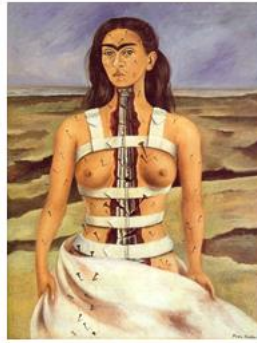
פרידה קאלו, עמוד (שידרה) שבור , 1944, שמן על טיח, מוזיאון קאלו, מקסיקו סיטי