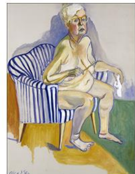
אליס ניל, דיוקן עצמי, 1980, שמן על בד, גלריה לאומית לדיוקן, סמיתסוניאן, וושינגטון.