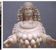
ארתמיס מאפסוס, מאה שניה לפנה"ס, מוזיאון אפסוס, טורקיה