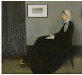
גיימס מקניל ויסלר, קומפוזיציה באפור ושחור (אם האומן), 1971, שמן, 144.3X162.4, אורסיי, פרוז