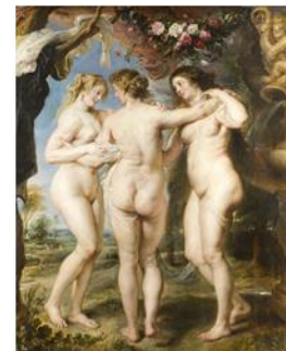
רובנס, שלושת הגרציות, 1636-8, שמן, 211X181, פראדו; שמאל: שלושת הגרציות, פיסול יווני מאה 2 לפנה"ס,