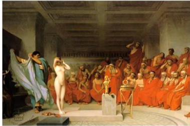
גירום, פרינה (Phryne) נחשפת לפני האריאופאגוס, 1861, 80X128 קונסטלה, המבורג. (פרינה שימשה מודל לאפרודיטה של פרקסיטלס)

העירומות והעירומים הקלאסיים והקלאסיציסטיים. דוגמאות: אפרודיטה מקנידוס הקלאסית של פרקסיטלס ו ונוס ממילו ההלניסטית, שתיהן מהאמנות היוונית.