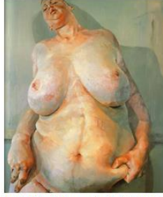
ג'ני סאויל, Branded , (מוטבעת) 1992, שמן, 213X183, לשכבר בגלריה סאצ'י, לונדון.