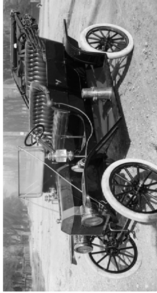
פורד מודל T, שנת יצור 1910

התפוררות העולם כולו... הכל נעשה כהתפוררות העולם כולו... הכל נעשה