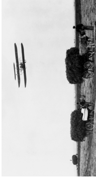
המטוס הדרז-כנפני של האחים רייט, מעל שטח חקלאי, 1909. עבר ועמד

"ברצמבר 1910, פחות או יותר, השתנה האופי האנושי", טענה וירג'יניה וולף בחירתה נפלה דווקא על 1910. אך קיימות אפשרויות אחרות. שני העשורים הראשונים של המאה ה-20, לפחות עד מלחמת העולם הראשונה, היו משופעים במהפכות כלכליות, חברתיות ואינוטקטואליות, שבזן לקחו חלק המדע, הטכנולוגיה והפילוסופיה. בשנת 1900 יצא מקס פלאנק עם תורת הקוונטים שלו, שגרמה מהפכה במדע. באותה שנה