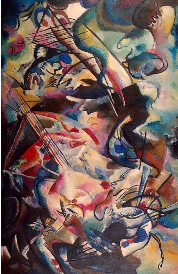
וואסילי קנדינסקי, קונטאק, 1915, VI

בלא-מודע, להיאוריה שלו היה משקל רב בהתפתחות האמנות במאה ה-20, ובמיוחד בשנים שבו שתי מלחמות העולם. הגה כי כן, ההדפדה המיעיית של תחילה המאה ה-20 השפיעה על האמנות הודת לשניו בתפיסת האובייקט, אשר גרסה כי הזמן, החל והתנועה מהווים חלק בלתי-נפרד מן האובייקט, ולוקחים חלק בייצוגו. במקביל, תפיסת הזמן השתנתה ממחיה מציפה למחוח משתנה ולא-חומרית, ולכן אין קשר הכרחי בין מציקת הזמן ובין המאסה, וניתן להמיר חומר ב"דברים" שאינם חומר, דוגמת אנרגיה, תפיסות אלו יצרו אקלים תרבותי שהשפיע עמוקות על האדם היוצר, העניק לו חופש פעולה ביחסו לאובייקט ואיפשר לו ליצור מציאות, שאמנם אינה מציפה וקבועה, אך היא בכל זאת אמיתית. תפיסות אלה הביילו לשימוש באמצעים אמנותיים חדשים – החלל והזמן, כאשר החלל ממלא את המקום המסורתי של הזמן, ומעוצב לצורה פיסולית בעזרת הקו.