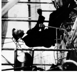
וילבור רייט בתא הטיסה, דרום צרפת, ינואר 1909

מוסיקה א-טונאלית, וערער את מבנה הקונפורמיציה המסורתית. ב-1905 יצא אלברט איינשטיין עם תורת היחסות הפרטית שלו, ושינה כליל את תפיסת הזמן, החלל והחומר של הפיזיקה המסורתית. בשנת 1910 גילה ארנסט רתרפורד את קיומו של גרעין האטום, וב-1911 הציע מודל מתוקן למבנהו. ב-1913 פיתח נילס בוהר את לעקרונות ההתאמה של מפניקת הקוונטים. פירוק האטום עירער את תפיסת החומר המסורתית והשפיע על אמנים רבים, בין היתר על קנדינסקי, אשר סירב ב-1910: "התפוררות האטום הייתה כשכלי